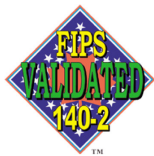
FIPS 140-2 Inside